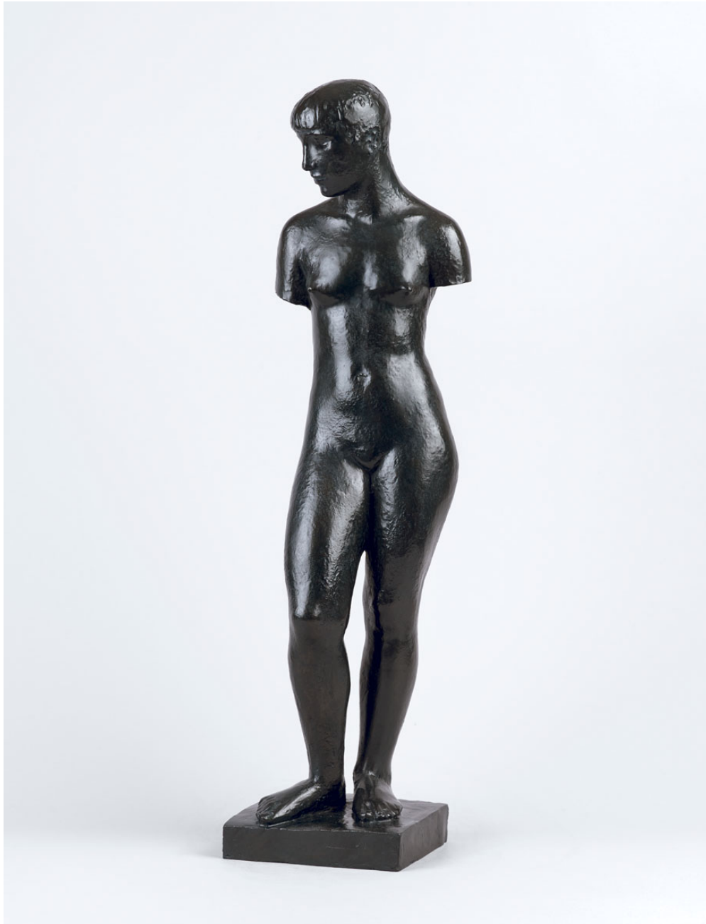
Charles Despiau (1874-1946), L'Adolescente (Figure avec tête et sans bras) Épreuve en bronze, n°5/6, Fonte à la cire perdue Claude Valsuani Signé : C. Despiau, H. 64 cm