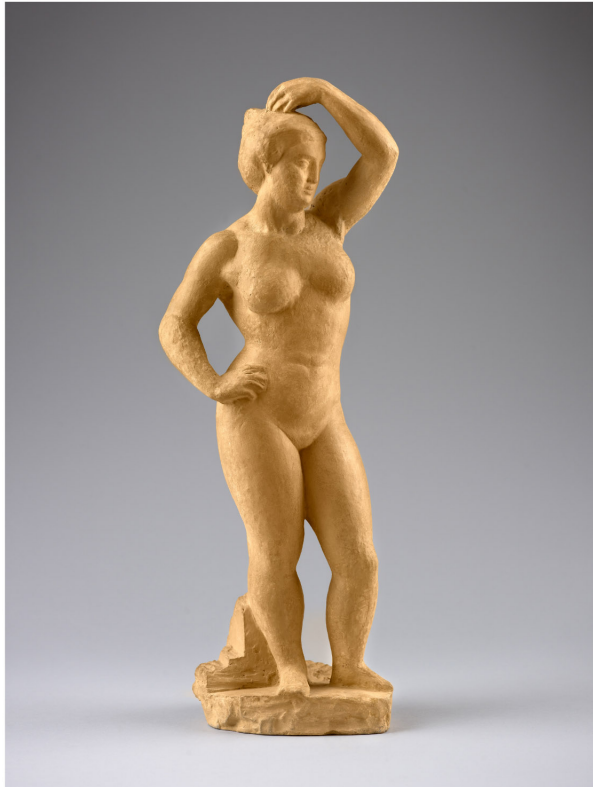
Manuel Martinez Hugué dit Manolo (1872 - 1945)